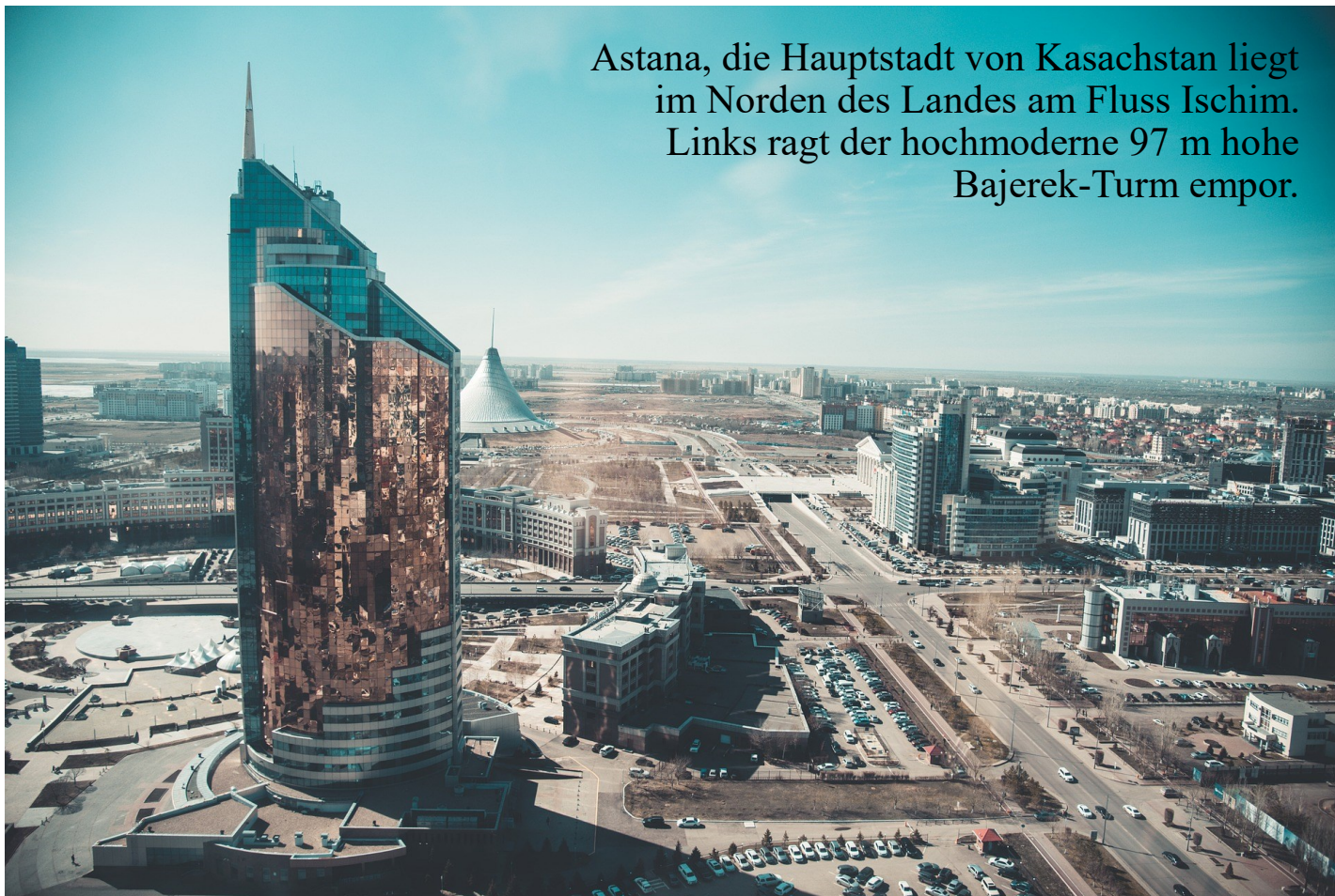
Astana, die Hauptstadt von Kasachstan liegt im Norden des Landes am Fluss Ischim. Links ragt der hochmoderne 97 m hohe Bajerek-Turm empor.

Erstens ist Kasachstan ein multiethnisches Land mit über 130 Nationalitäten und ca. 30 Konfessionen. Nach dem Zerfall der Sowjetunion, als in fast allen ehemaligen Sowjetrepubliken ethnische Konflikte ausgebrochen waren, gelang es der damaligen kasachischen Staatsführung die Gefahr einer Destabilisierung des Landes einzudämmen. Dem heutigen Präsidenten Kasachstans Kasym-Shomart Tokaew zufolge verwandelte sich zu Beginn der 90-er Jahre die bis dahin als Reichtum angesehene ethnische Vielfalt in ein Pulverfaß. Nationalistische Kräfte versuchten damals unter der Losung „Kasachstan – für Kasachen!“ eine Fehde anzuzetteln. 1986 provozierten junge